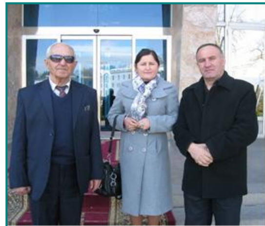
The members of the Working Group Рабочая Группа